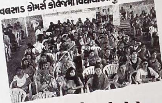
વલસાડ કોમર્સ કોલેજમાં વિદ્યાર્થીઓનું અભિવાદન

કોમર્સ કોલેજ વલસાડમાં પુસ્તક પરિચય કાર્યક્રમ અંતર્ગત પ્રિ.જે.ટી.દેસાઈ દ્વારા “ઈન્ડિયા આફ્ટર ગાંધી” પુસ્તકનો પરિચય કરાવાયો