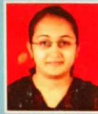
T. Y. B. Com.