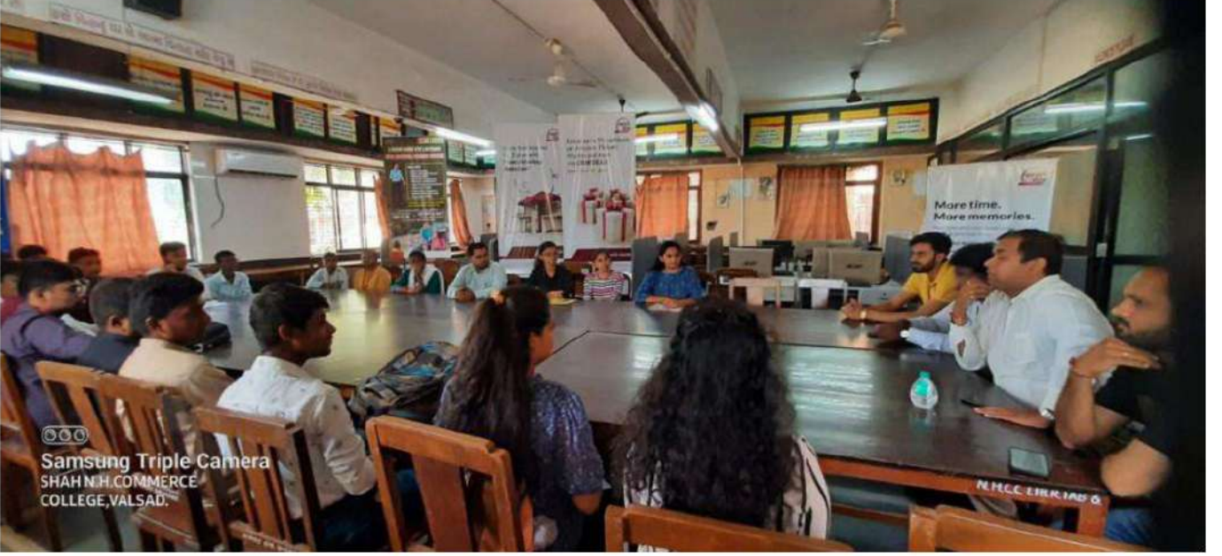
ECO CLUB SHAH NHCC MOU WITH NURSARY 28/04/2022

Email: shahncc@yahoo.com / principalshahncc@gmail.com Web Site : www.shahncc.com